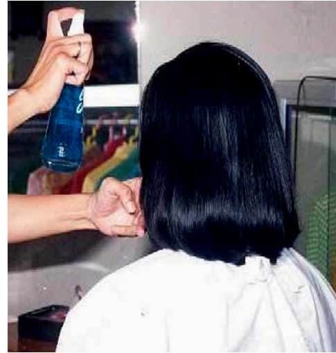
Gambar 3.9. Pemberian Kosmetika Rambut