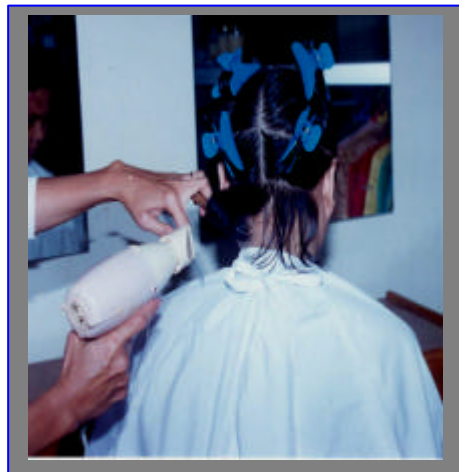
Gambar 3.6. Cara Mengeringkan Dengan Sisir Blow