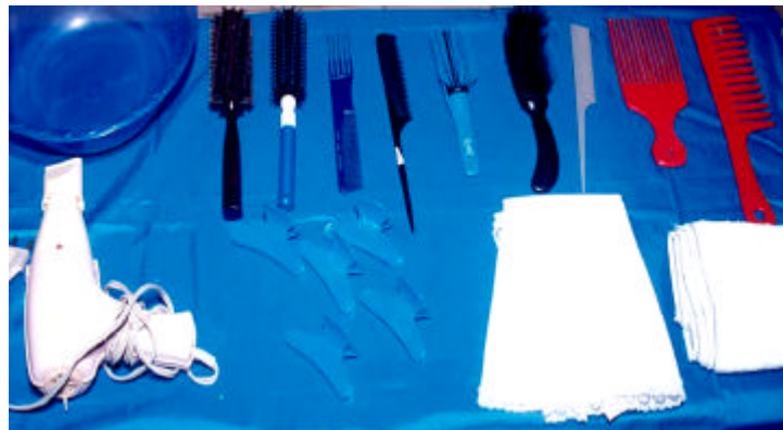
Gambar 3.1. Alat-alat dan Lenan untuk Pengeringan Rambut

Pada Tabel 3.1 berikut ini merupakan alat dan lenan yang perlu dipersiapkan sebelum melakukan pengeringan rambut.