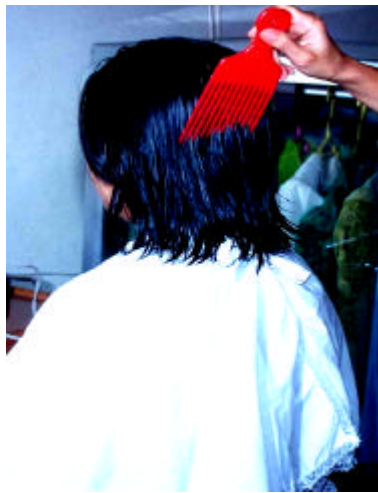
Gambar 3.3. Penyisiran Dengan Sisir Garpu