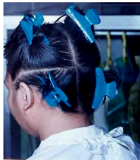
Gambar 3.5. Parting Rambut 4 Bagian