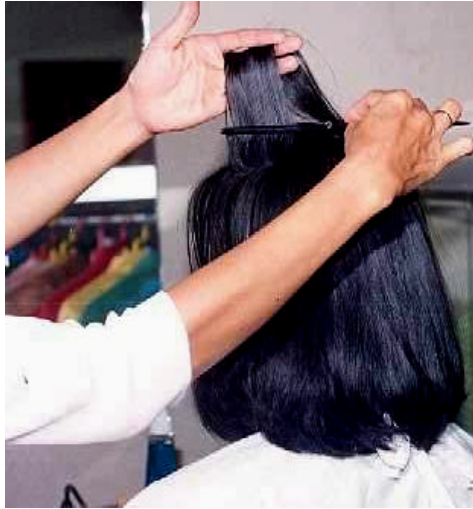
Gambar 3.8. Membentuk Penataan Rambut