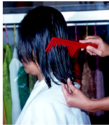
Gambar 3.4 Penyisiran Dengan Sisir Besar