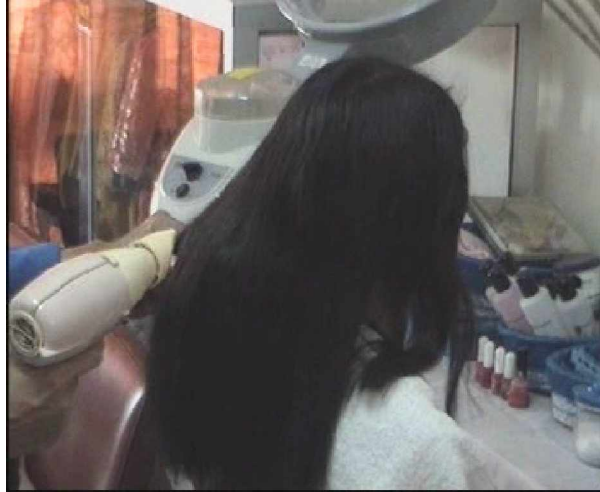
Gambar. 2.14. Hasil Akhir Pengkondisian dengan conditioner khusus