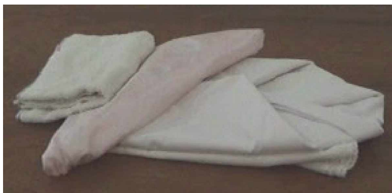
Gambar 2.2. Lenan pengkondisianan rambut

Daftar lenan yang digunakan pada pengkondisianan rambut secara lengkap dapat dilihat pada gambar 2.2 berikut.