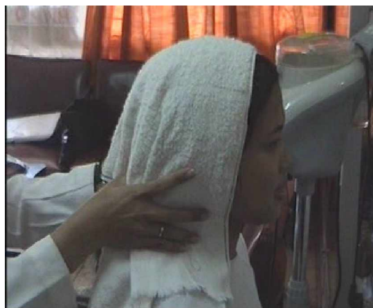
Gambar. 2.13. Pembilasan Conditioner Khusus dengan air bersih