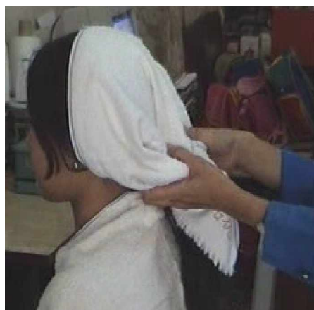
Gambar. 2.7 Pembilasan dengan air bersih dan Pengeringan dengan handuk