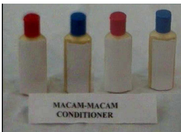
Gambar 2.4. Kosmetik Pengkondisian rambut

Adapun kosmetik pengkondisian rambut secara lengkap dapat dilihat pada gambar 2.4 berikut ini.