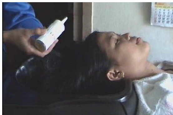
Gambar. 2.6. Proses pengkondisianan rambut

Pada proses pengkondisianan rambut, usahakan merata ke seluruh rambut agar hasil lebih maksimal