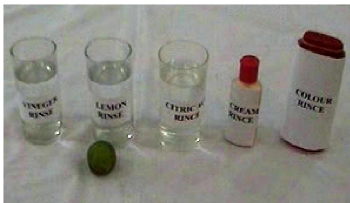
Gambar 2.3 Kosmetik pembilas Rambut

Adapun sifat atau asal bahan kosmetika pembilas rambut di atas secara rinci dapat dijelaskan sebagai berikut.