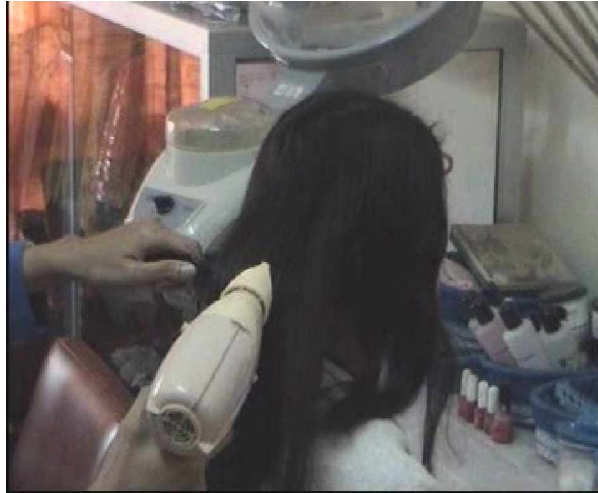
Gambar. 2.17. Hasil Akhir Pengkondisian Rambut Dengan Color rinse

(3) Lakukan penataan sesuai yang diinginkan.