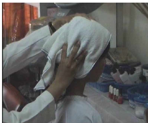
Gambar. 2.16. Pengeringan dengan handuk setelah pembilasan Color rinse Dengan air bersih.

(2) Bilas dengan air biasa sampai bersih dan keringkan dengan handuk