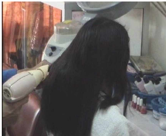
Gambar. 2.11 Hasil akhir pengkondisian dengan lemon rinse