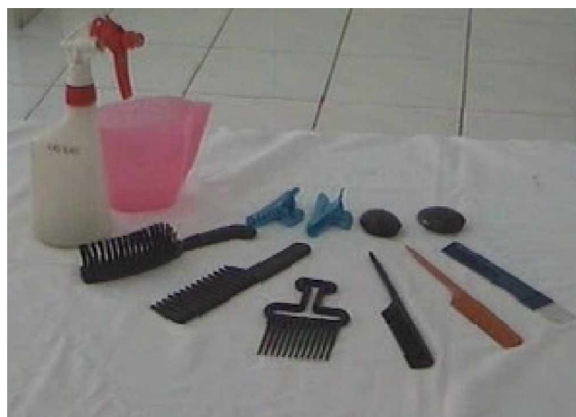
Gambar 2.1 Alat Pengkondisian Rambut

Alat pengkondisian rambut secara lengkap dapat dilihat pada gambar berikut ini: