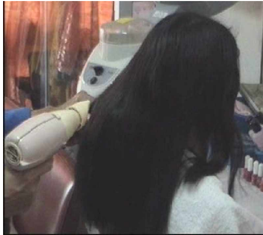
Gambar. 2.8 Hasil akhir pengkondisian rambut