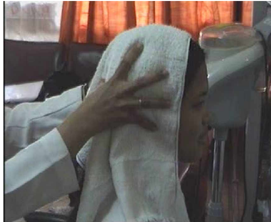
Gambar. 2.10 Pembilasan Lemon rinse dengan air bersih